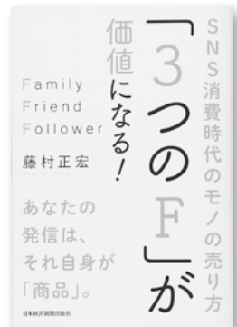
最新刊「3つのF」が価値になるSNS消費時代のモノの売り方

1958年、北海道釧路生まれ。明治大学文学部卒業(演劇学専攻)早稲田大学演劇研究会にて演劇をプロデュース。大学卒業後、株式会社京屋にてヴィジュアルプレゼンテーション、ニューヨーク大学にて映画製作の勉強等を経験後、フリーバレットを設立し、ウインドディスプレイに従事。1992年(株)ラーソン・ジャパン取締役に就任後、各種集客施設の企画に演劇の手法を取り入れて成功。ヒトの潜在意識に影響する要素を注意深く分析して企画に取り入れるほか、体験を売るという「エクスペリエンス・マーケティング」の考え方で集客施設や会社のコンサルティングを行っている。現在フリーバレット集客施設研究所主宰。